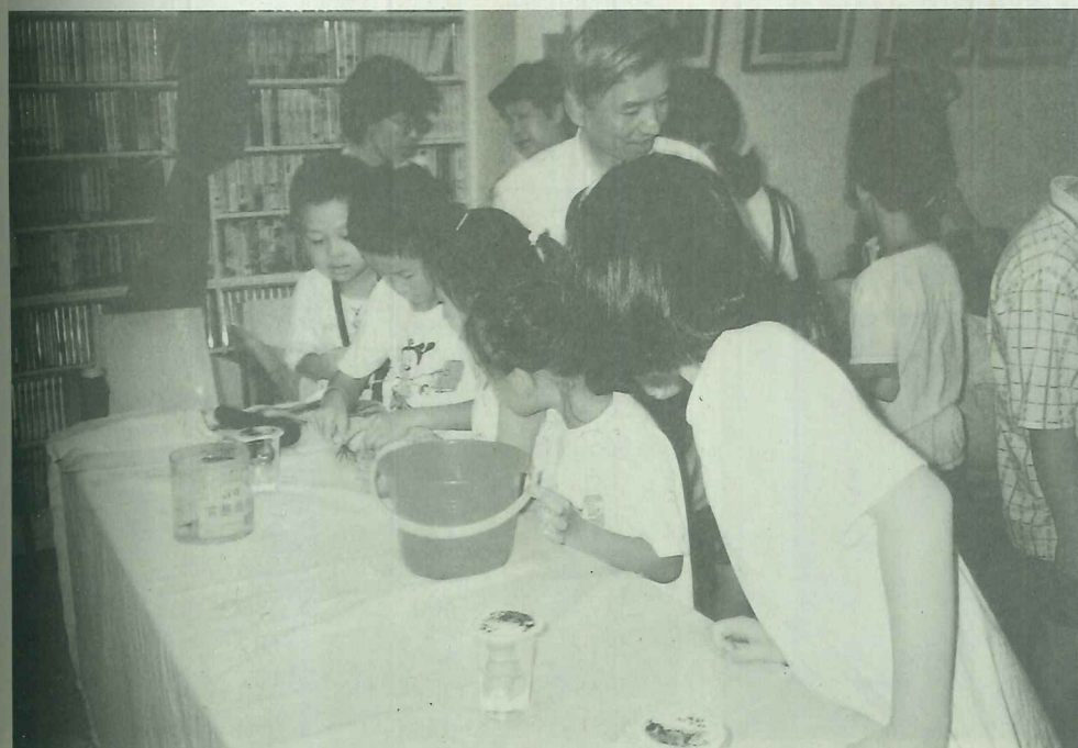
參加「放養蟹殼」活動的小朋友好奇地觀察研究寄居蟹