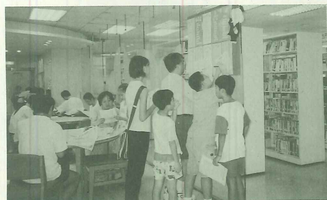
全家動員尋找過關答案

而來不及報名「閱讀尋寶」的同學，還可以參加「暑期閱讀俱樂部」，凡鎮內國中、小同學在暑假七至八月間在鎮立圖書館或竹圍分館借書達三本者，可向服務台索取閱讀心得格式並寫下心得報告，連同書本交予館員檢查核章，即可獲得100元圖書禮券。「暑期閱讀俱樂部」名額有限，淡水本館限300名、竹圍分館限150名，希望同學們把握暑假時光，到圖書館尋到寶藏、也找到閱讀的樂趣。