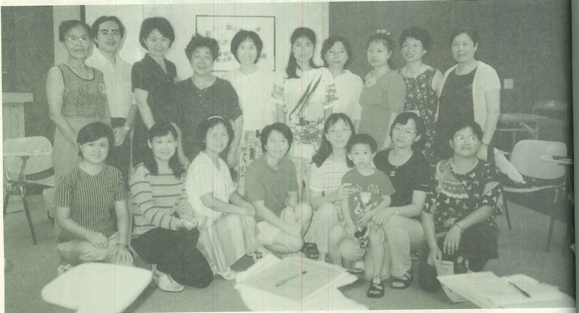
鎮民大學「聽老師說故事」第二期結業合照

雖然，故事媽媽在淡水還在啓步階段，主的故事爸爸、故事媽媽仍渴望學習更多的知識技巧。但是，大家一致都希望這個有意義的動，能早日散播到淡水各國小、各社區，讓淡水的孩子們能享有更多、更美好的故事童年。