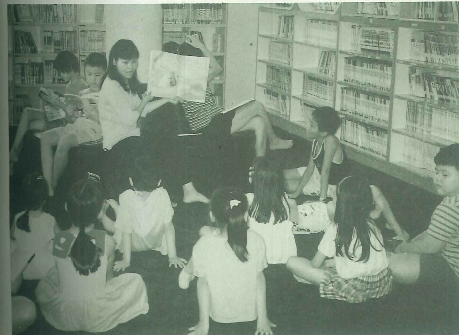
故事媽媽以豐沛情感朗讀繪本文字，引導孩子進入童話的世界

孟夏的八月裡，還有好幾個周六，若想親子同炙一個快樂的故事童年！！週六的午後，鎮立圖書館的兒童室，將是一個最好的選擇。