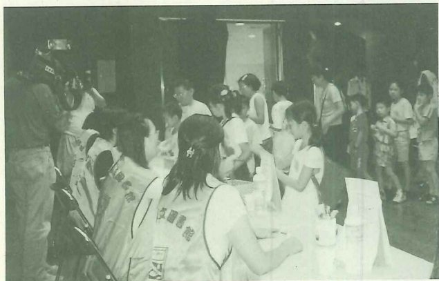
參賽隊伍依序抽取關關題目

暑假已經過了一半，同學們除了郊遊踏青、戲水消暑、參加夏令營活動外，還可以到圖書館尋寶喔！